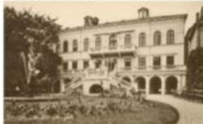
Læseforeningen, ca. år 1900