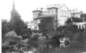
Industripalæet, ca. år 1904