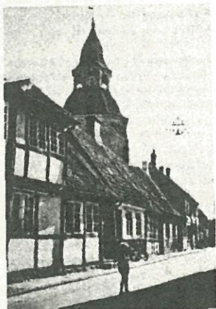
Klokketårnet i Fåborg...

Tilmelding er ikke nødvendig, - med op i stedet for!