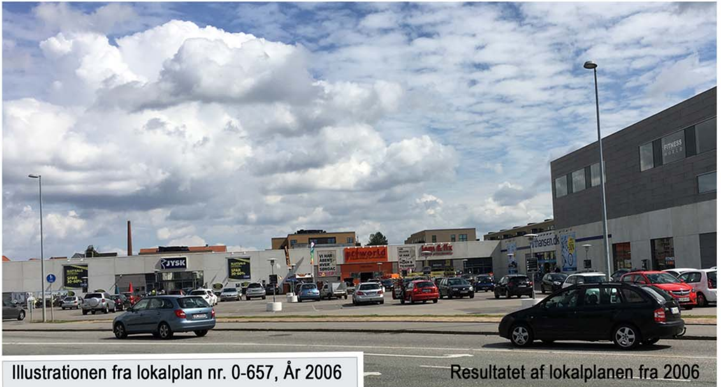
Resultatet af lokalplanen fra 2006

Porten til Odense Centrum fra vest - 1,5 km fra Flakhaven Krydset Grønløkkevej - Vesterbro/Middelfartvej