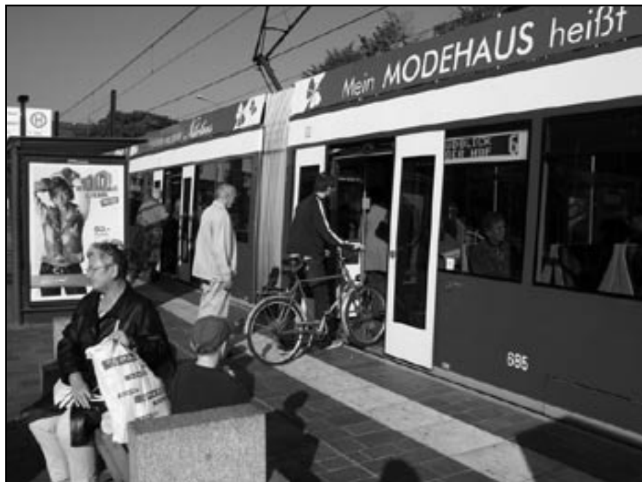
foto: niveaufri indstigning, Letbaner.DK