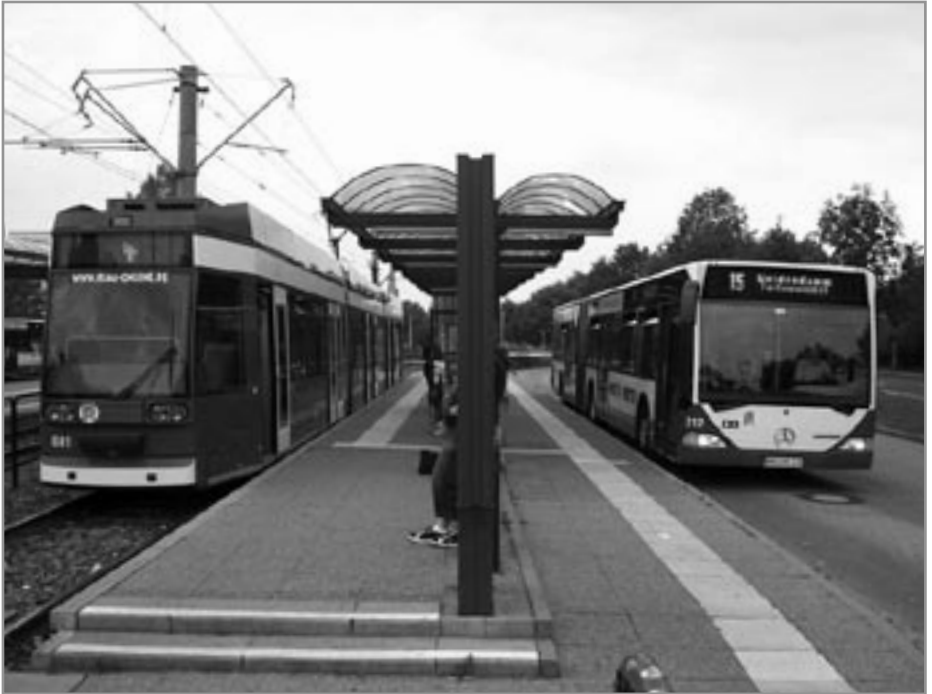
foto: Hurtige omstigningsmuligheder mellem letbane og bus. Det kunne være på Banegårdspladsen i Odense. Letbaner.dk

kollektive trafik i udlandet stiger med ca. 25% i løbet af få år, i kvarterer hvor letbaner erstatter de mest benyttede buslinjer.