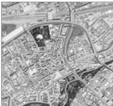
Illustrationer: Odense Kommune

Byens nuværende gadestruktur underbygger ikke ønsket om helt at lukke