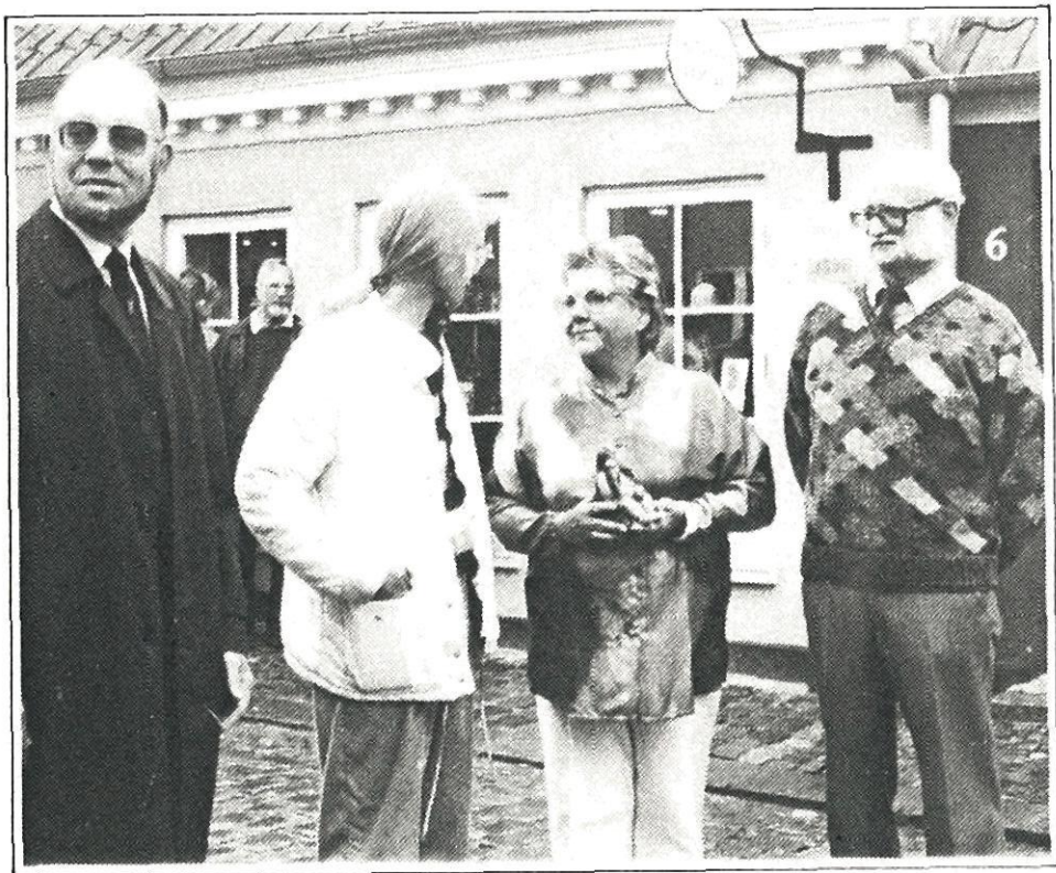
Overrækkelsen af Odinprisen