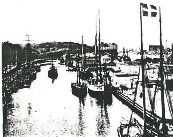
Odense Havn set fra Toldboden ca 1910. Dengang et yndet postkortmotiv.

Der bliver mulighed for at få førstehåndskendskab til planerne på foreningens havnevandring.