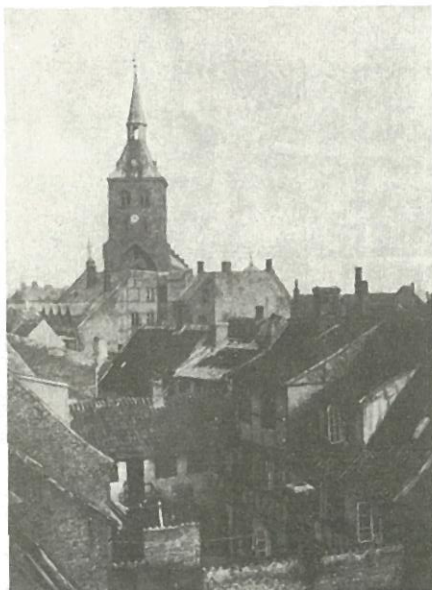
Datidens by - Odense i 20'erne...