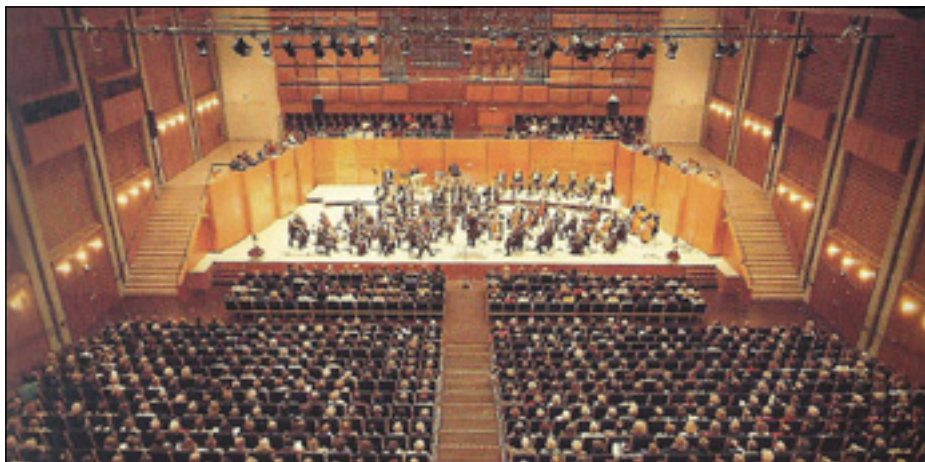
Koncert med Odense Symfoniorkester i Koncerthuset.