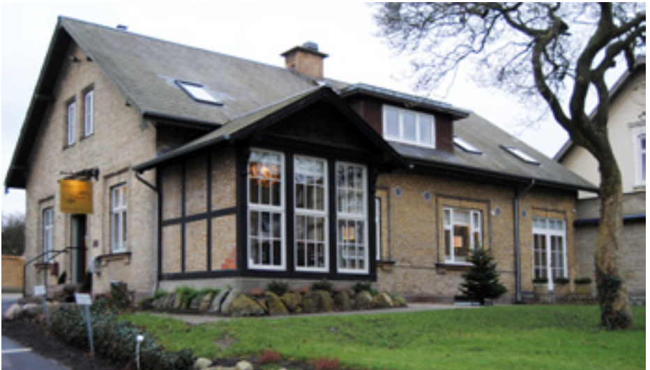
Hunderupvej 22, som den ser ud i dag, som nabo til Odd Fellow Logen

Da man begyndte at grave, viste det sig nemlig, at lige under gruslaget traf man på gamle pælerester, og så blev museet tilkaldt. De konstaterede, at det var resterne af palisader og en voldgrav.