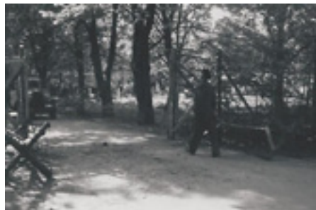
Billeder taget i smug, mens tyskerne vogtede huset

Det lattede den anspændte situation, og tyskerne fortalte, at man ved et sikkerhedstjek af huset havde opdaget granaten. De tilkaldte bombeekspertes havde forsigtigt flyttet granaten op i haven, men i øvrigt erklæret den for ufarlig.