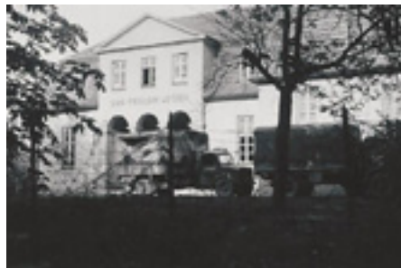
Odd Fellow Logen bag pigtråd og militære køretøjer

Haven var blevet et virvar af pigtråd og forvoksede hegn, så der blev gjort kort proces og opført en hegnsmur i bagha-