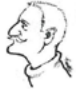
tegnning: Hjørdis Plato

Uddrag af artikel i Odense Symfoniorkesters 50 års jubilæumsbog: Fra Byorkester til Symfoniorkester 1996.