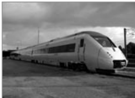
IC4 tog

Det er helt forrygende at høre den nuværende transportminister nok engang servere absolut gammel vin på nye flasker, når vi skal høre om idéen om at indføre timedriftsplaner for tog i Danmark med en time mellem de større byer. En time fra København til Odense, en time fra Odense til Århus, en time fra Århus til Ålborg, en time fra Odense til Sønderborg. Den idé var en erklæret målsætning i Sølvgade allerede for mere end 25 år siden. Jovist, togdrift tager tid og når idéen har været glemt tilstrækkelig længe, så kan den åbenbart serveres som en helt ny idé.