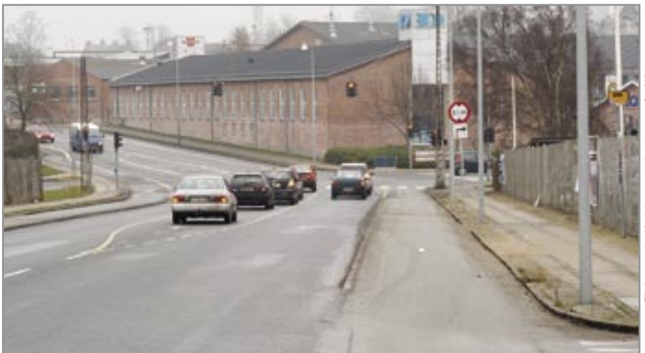
Ejlskovsgade/Jarlsberggadekrydset set fra Wichmannsgade