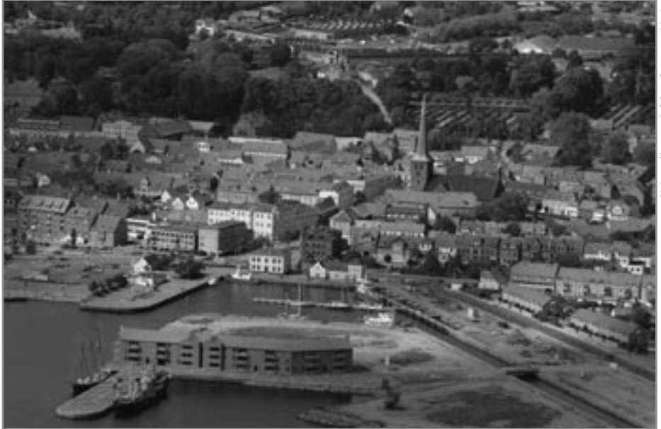
Nyborg Havn

summen af enkeltprojekter eller er et udviklingsområde styret af en forudgående fastlagt vision?