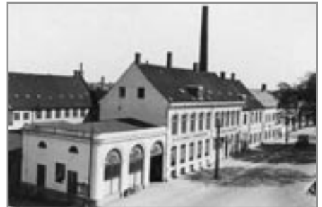
ca. 1900