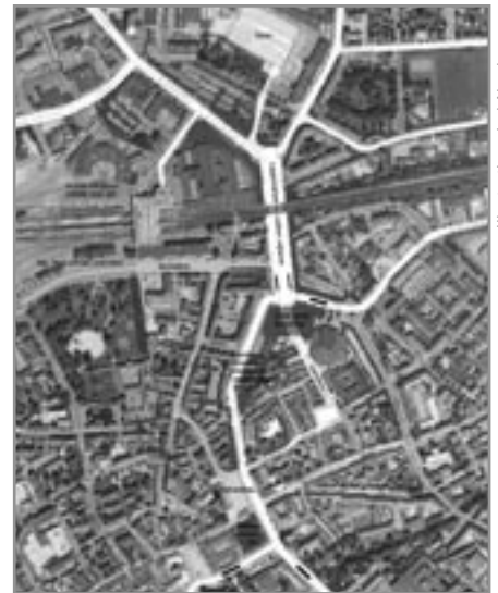
illustration: Jarl Abrahamsen

Under boulevarden, mellem åen og Stationsvejen, etableres en række underjordiske parkeringsanlæg som supplement til de eksisterende parkeringspladser under Albani Torv og Fisketorvet. Disse anlæg sammenbindes af en underjordisk parkeringsgade, kun for personbiler.