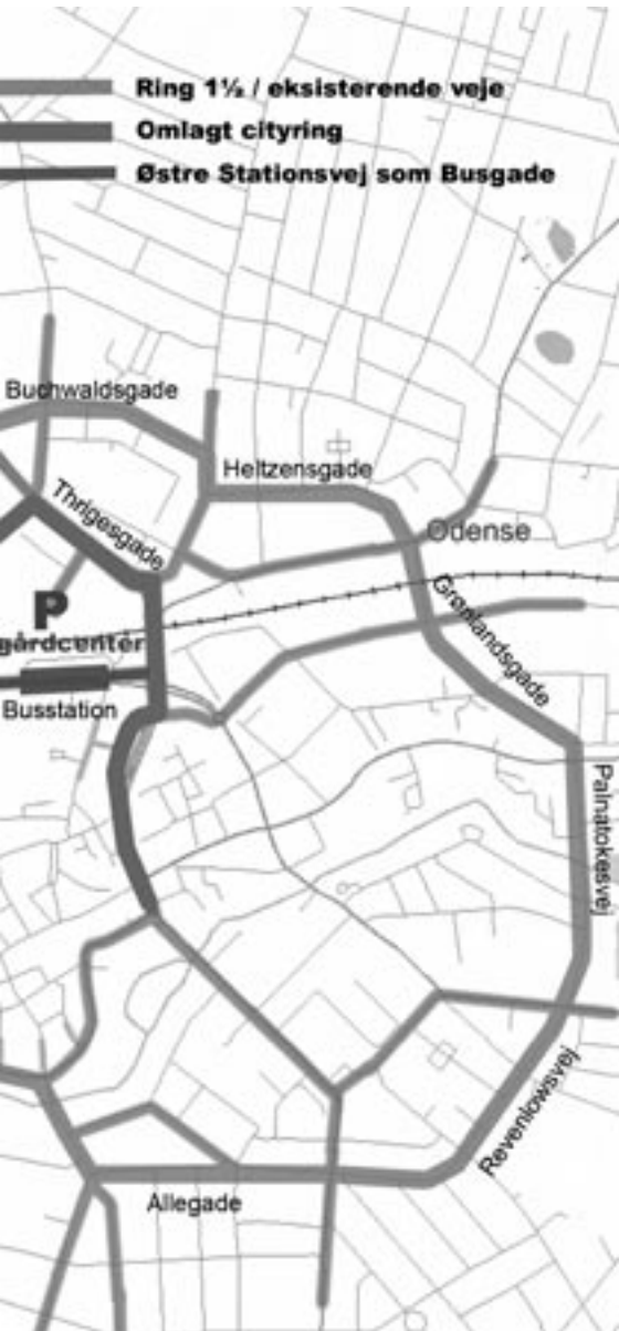
Illustration: Jarl Abrahamsen

til Thomas B. Thrigesgade - og omdannes til bus-/taxigade.