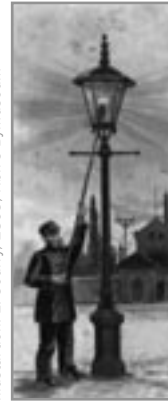
Illustration: E. Sedivy, 1893, Kbh's Bymuseum

Det var netop den sidste aften, de gamle trandlygter var tændte; byen havde fået gas og den strålede, så at de gamle lygter ligesom blev rent borte i det.... Folk gik op og ned for at se på den nye og gamle belysning.