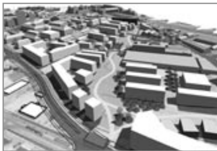
Illustrationer: Kvarterplan By-Havn Odense Kommune

Vigtigheden af at stibroen bliver noget helt særligt, en attraktion i sig selv, kan ikke undervurderes.