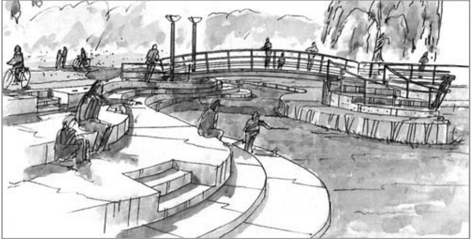
illustration: folder udarbejdet af Odense Kommune

I forbindelse med planerne for at indrette en fiskepassage ved Havhesten i Munke Mose, har Park & Vej afdelingen benyttet lejligheden til at supplere med planer for en renovering af dette traditionelle mødested for forskellige grupperinger af odenseanere.