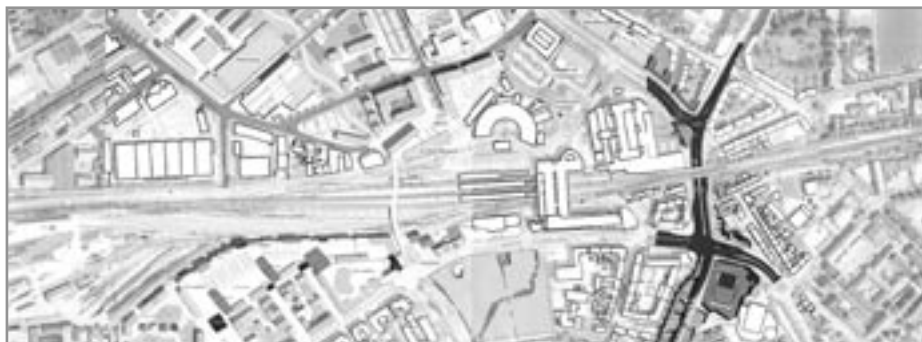
Illustration: Kvarterplan By-Havn, Odense Kommune

tid > torsdag den 19. april, klokken 19 00 sted > Soldaterhjemmet Dannevirke, Sdr. Boulevard 15