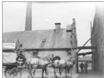
cirka år 1930

Bygningerne har i gennem næsten 150 år været et markant bybillede i Odense. Men har desværre også lidt den tort at blive maltrakteret gennem talrige om-